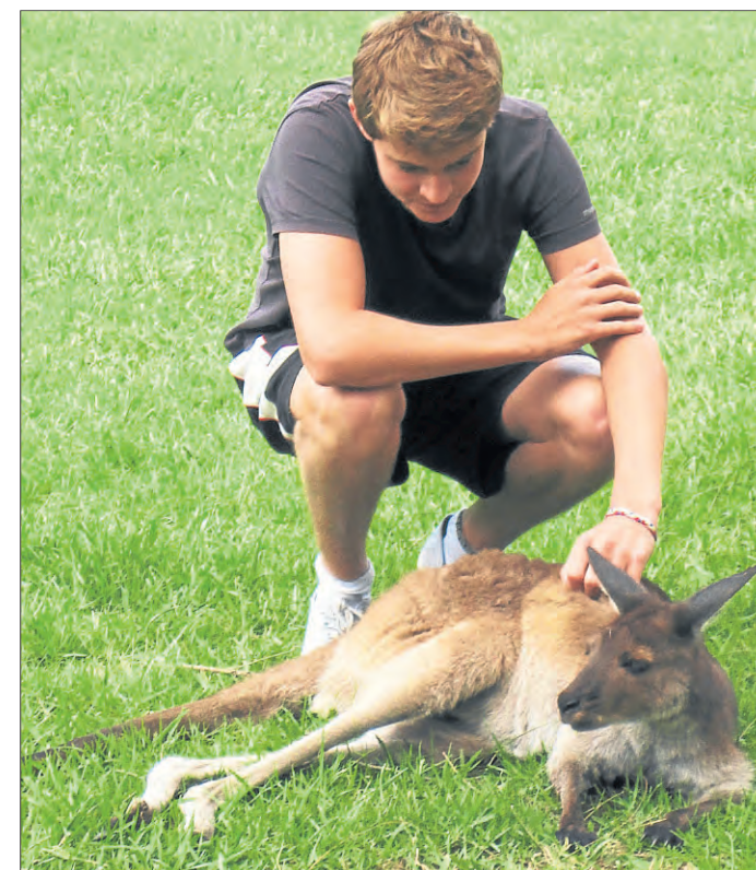
Zeit für Streicheleinheiten: Das Känguruh scheint es zu genießen.

Seit einem halben Jahr spielt er für den „Mona Vale Tennis Club“ in der australischen „Premier League“. Dies ist die höchste Spielklasse für